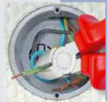
Schlanke Kopfform und exakter Schnitt an den Schneidenspitzen: vorteilhaft beim Einsatz in schwer zugänglichen Arbeitsbereichen