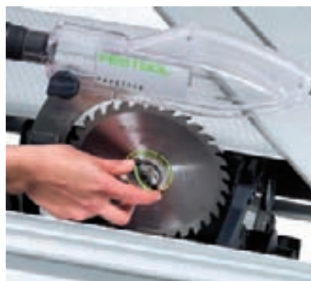
Mit dem werkzeuglosen Sägeblattwechsel schneller zum passenden Sägeblatt.