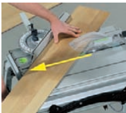
Die PRECISIO CS 50 hat einen beeindruckenden Zugweg von 304 mm.

Die Broschüre zur PRECISIO CS 50 finden Sie unter www.festool.de/downloads