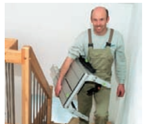
Das ist absolute Spitzenklasse: Die PRECISIO CS 50 wiegt nur ca. 17,4 kg in der Floor-Variante ohne Klappbeine.