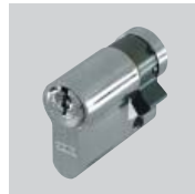
C 83 halb