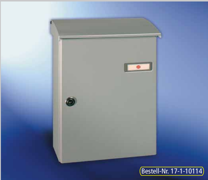
Abb. 240/1 Aufhängebriefkästen mit Einwurfdeckel im CONVEX-Design.

Alles Gute kommt von oben. Durch den Einwurf von oben passt die Post problemlos in den Kasten. Der Regenschutz wird durch den selbstschliessenden Deckel gewährleistet.