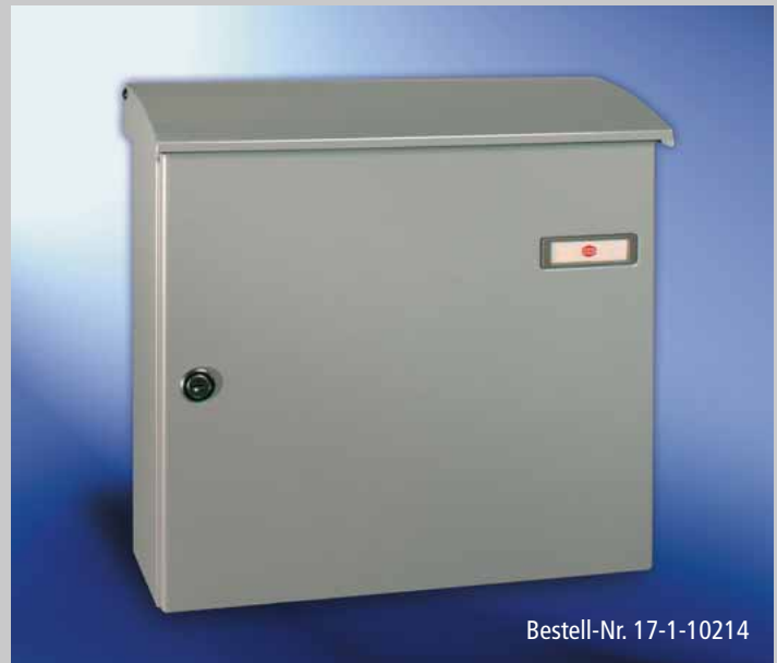
Abb. 240/2 Aufhängebriefkästen mit Einwurfdeckel im CONVEX-Design.