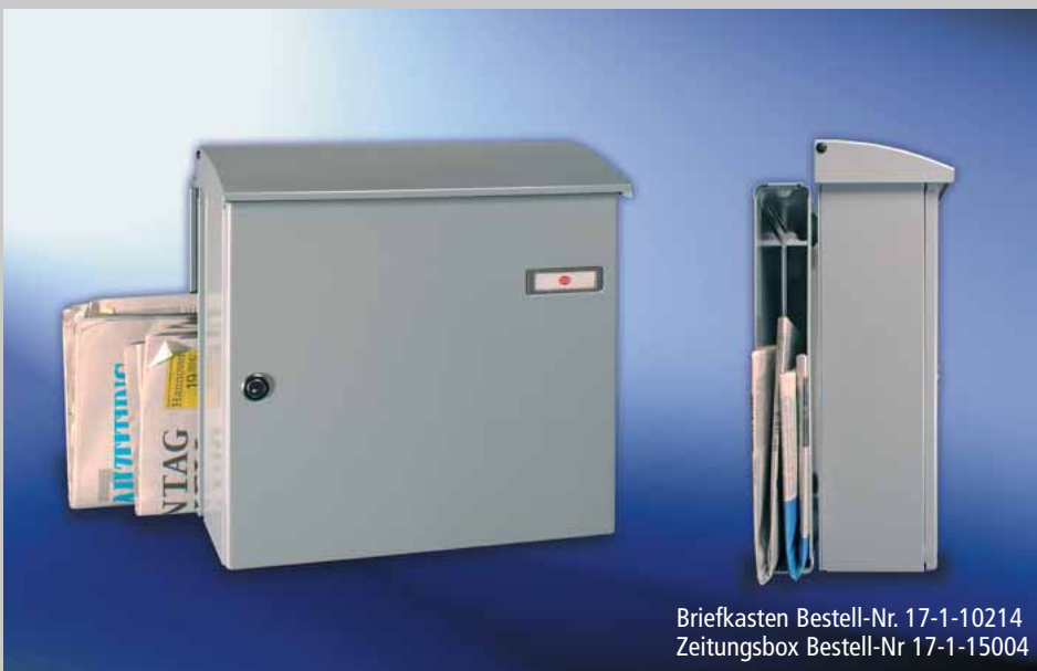
Briefkasten Bestell-Nr. 17-1-10214 Zeitungsbox Bestell-Nr 17-1-15004