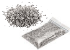
Spezialgranulat 0,50 kg Art.-Nr. 21823